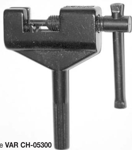
Dérive-chaîne VAR CH-05300

Compatible avec les chaînes 7, 8, 9 et 10 vitesses incluant Shimano® HG® & IG®, SRAM®, Campagnolo®.